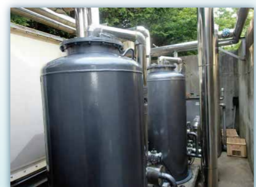
ろ過器点検・修理