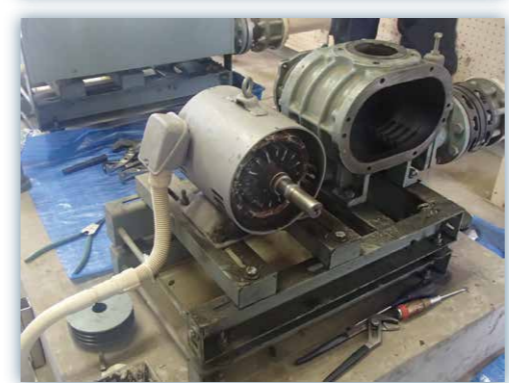
ブローオーバーホール