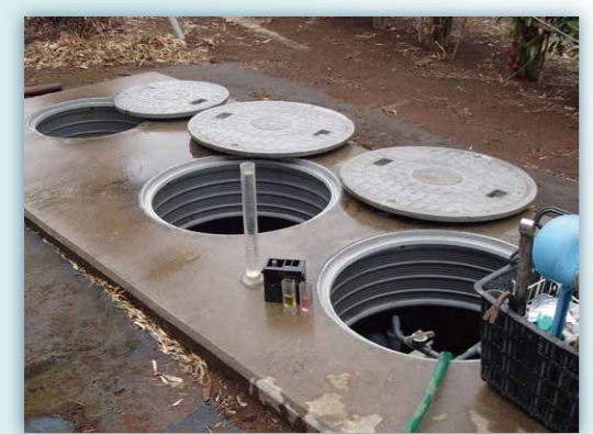
一般家庭(小型合併浄化槽)